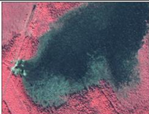
Рис. 1. Нефтяное загрязнение с массивом погибшего леса на космическом снимке QuickBird