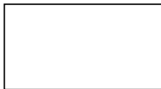
Рис 1. Пример оформления рисунка

Для таблиц сначала приводится номер таблицы, выровненный по правому краю, затем заголовок таблицы, выровненный по центру, и сама таблица. Номер и заголовок таблицы выполняется шрифтом размером 14, текст таблицы – размером 12. Если для ячейки отсутствуют данные, в ней ставится прочерк.