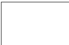
Рис 1. Пример оформления рисунка

Для таблиц сначала приводится номер таблицы, выровненный по правому краю, затем заголовок таблицы, выровненный по центру, и сама таблица. Номер и заголовок таблицы выполняется шрифтом размером 14, текст таблицы – размером 12. Если для ячейки отсутствуют данные, в ней ставится прочерк.