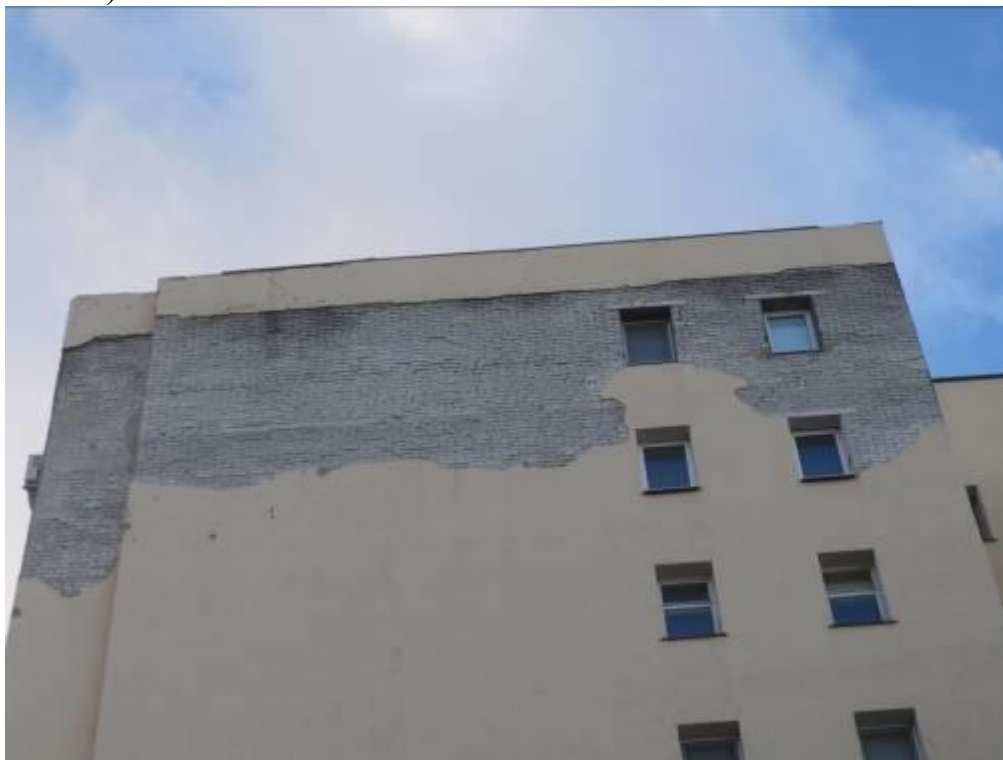
Фото1. К выполнению РГЗ (указывается адрес объекта)

Определить физический износ отдельных элементов здания, составить ведомость дефектов, составить задание на проектирование (ремонт) конструкций (см. ФОТО).