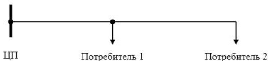
Рисунок - Схема электроснабжения

На рисунке показана схема электроснабжения двух потребителей. В таблице приведены суточные индивидуальные графики электрических нагрузок потребителей с установленной номинальной мощностью ( P_{ном} ).